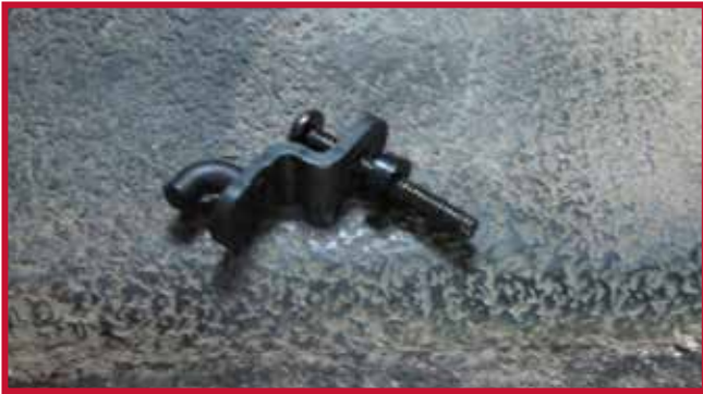
Figure 6 – Assemblage de crochet et d'espaceur

c) Introduzca el conjunto del gancho a través de la tapa de la transmisión y apriételo con un desarmador Phillips nº 3. Oriente el gancho del tapete para que apunte directamente hacia la palanca de cambios, como se muestra en la figura 7.