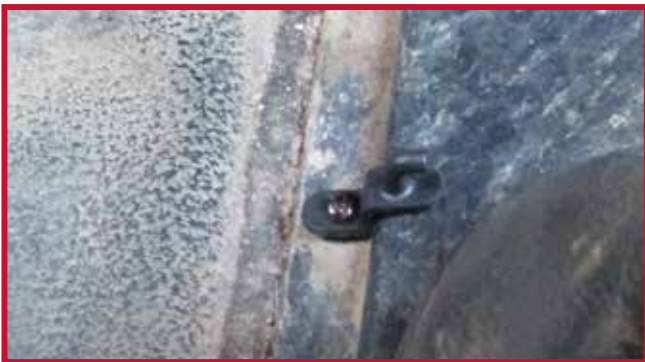
Figure 7 – Orientation appropriée du crochet

9. Instale el tapete del lado del conductor y encájelo en el gancho de retención. Si la posición de la base del asiento no es estándar o si el camión está equipado con asientos del mercado de accesorios, puede ser necesario recortar la parte trasera del tapete del conductor o del pasajero para que encaje. El tapete del conductor y del pasajero tiene un borde elevado para contener los líquidos y servir de guía para el corte. Utilice una navaja afilada como se muestra en la figura 8 para recortar el material y cortar a lo largo de la parte exterior del borde elevado, preservando el borde para la contención de líquidos.