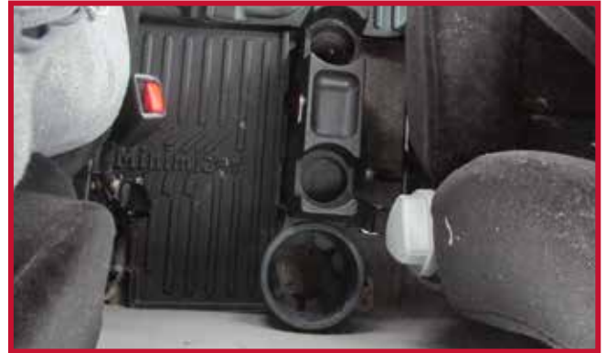
Figura 3 - Soporte para termos de fábrica

6. En los casos en los que se monta un extintor detrás del asiento del conductor, la esquina trasera izquierda del tapete central sombreada en amarillo puede recortarse para dejar espacio libre.