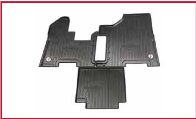
Figura 2 - Contenido del KIT FKP6B

Los camiones equipados con un soporte de termo de fábrica requieren el recorte manual del tapete central. Se ha moldeado una línea de corte elevada en el tapete para utilizarla como guía y para la contención de líquidos.