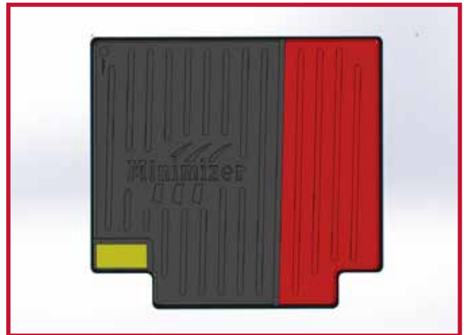
Figura 4 - Diagrama de recorte

7. A continuación, instale el tapete para el lado del pasajero del vehículo.