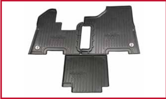
Figura 1 - Contenido del KIT FKP5B

• El kit FKP6B mostrado en la Figura 2 es compatible con los camiones Peterbilt 357, 377, 378, 379, 385 construidos antes del 5/2004.