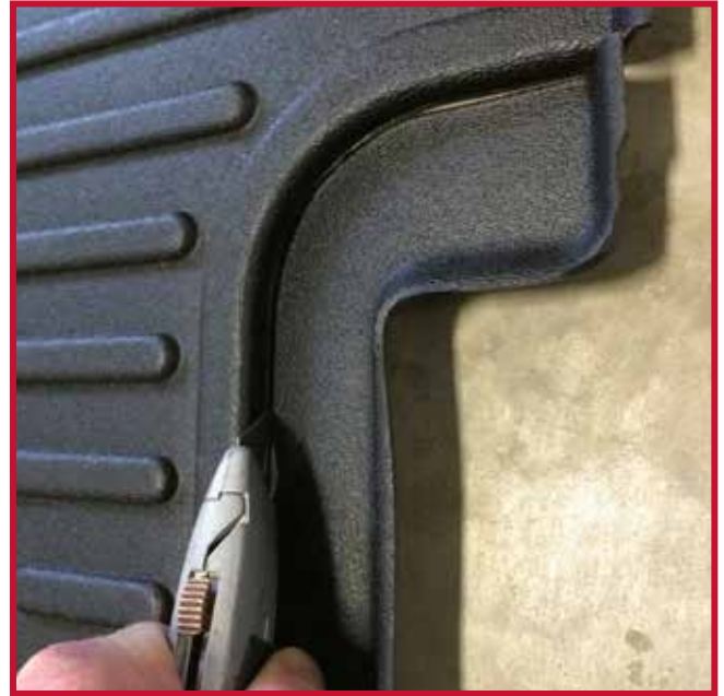
Figure 8 – Découpage pour les sièges du marché de l'après-vente

10. Tire del tapete del lado del conductor hacia la izquierda para confirmar que el gancho de retención está totalmente encajado y bien sujeto al piso. Si el gancho no funciona correctamente o el tapete no puede instalarse de forma segura, no utilice un tapete Minimizer en el lado del conductor del vehículo.