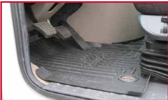
Figura 7 - Tapete del conductor en posición

8. Dentro del paquete con las instrucciones de instalación, localice un gancho de retención de plástico negro así como un tubo blanco de Primer 94 como se muestra en la Figura 8.