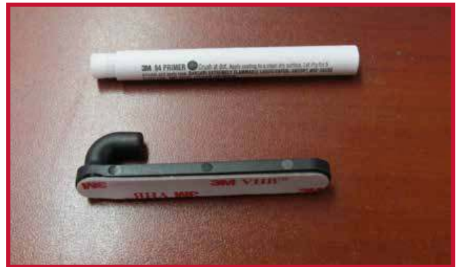
Figura 8 - Gancho y aplicación de Primer 94

9. Introduzca el gancho a través del orificio situado en la esquina trasera derecha del tapete del conductor, como se muestra en la figura 9. El gancho debe quedar al ras de la parte inferior del tapete del conductor.