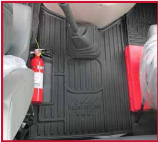
Figura 5 - Instalación del tapete central recortado

6. Enderece la funda de goma que rodea la palanca de cambios para que descansa suavemente sobre el tapete central, como se muestra en la figura 6.