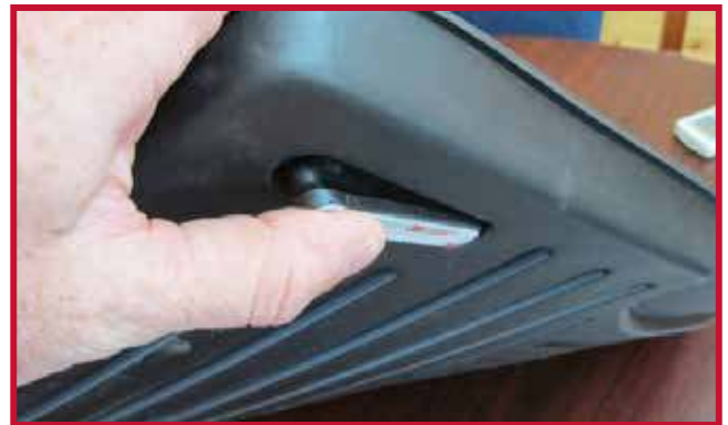
Figura 9 - Inserción del gancho

10. Una vez colocado el gancho, deje que el tapete del conductor y el gancho se apoyen en el piso, como se muestra en la figura 10.