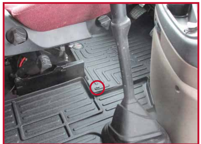
Figura 10 - Instalación del gancho del conductor

11. Marque con un dedo la posición aproximada en la que deberá fijarse el gancho al piso. Una vez localizada la posición, retire el tapete del conductor del camión.