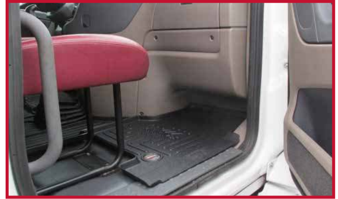
Figura 13 - Tapete de pasajero con asiento fijo

20. Tire del tapete del conductor hacia la parte delantera del camión para confirmar que el gancho está completamente encajado en el tapete y que el gancho está adherido al piso. Si el gancho no funciona correctamente o el tapete no puede instalarse de forma segura, no utilice un tapete Minimizer en el lado del conductor del vehículo.