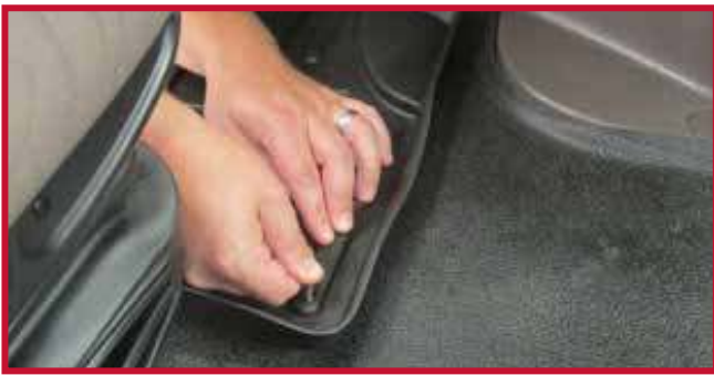
Figura 11 - Aplicar presión al gancho

18. Para lograr una adhesión óptima, no perturbe el gancho durante un período de 20 minutos después de la instalación. La figura 12 muestra la instalación correcta del gancho.