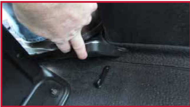
Figura 12 - Gancho correctamente instalado

18. Para lograr una adhesión óptima, no perturbe el gancho durante un período de 20 minutos después de la instalación. La figura 12 muestra la instalación correcta del gancho.