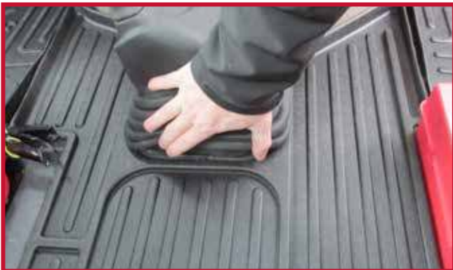
Figura 6 - Enderezar la bota de goma

7. Coloque el tapete del conductor en la carretilla como se muestra en la figura 7.