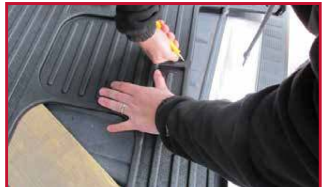
Figura 4 - Recorte con navaja

Nota: Utilizando los bordes de las costillas altas como guía, recorte la parte deseada del tapete con una navaja afilada como se muestra en la figura 4. Recorte siempre a lo largo del límite interior de la zona sombreada. Esto preservará el perfil de las costillas altas para ayudar a la contención de derrames.