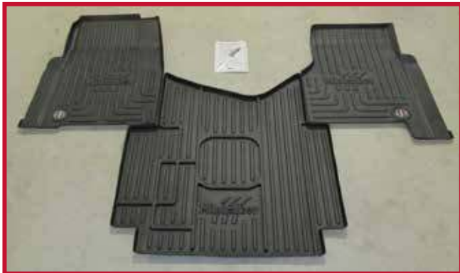
Figura 2- Contenido del kit FKFRTLASCMB