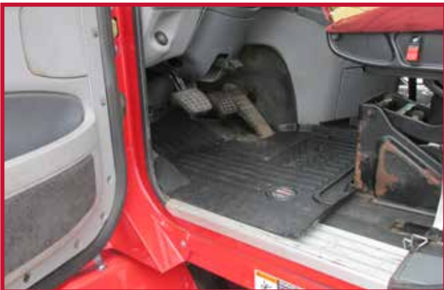
Figura 6 - Ajuste del tapete del conductor con la base del asiento OEM

Nota: Cuando se instala en camiones equipados con un asiento de conductor EzyRider, el material del tapete detrás del borde elevado tendrá que ser recortado con una navaja como se muestra en la figura 7. El borde elevado está diseñado para actuar como guía de corte y contener el líquido. Los camiones equipados con asientos del mercado de accesorios o cuya posición de asiento ha sido modificada también pueden requerir un recorte manual a lo largo del borde elevado.