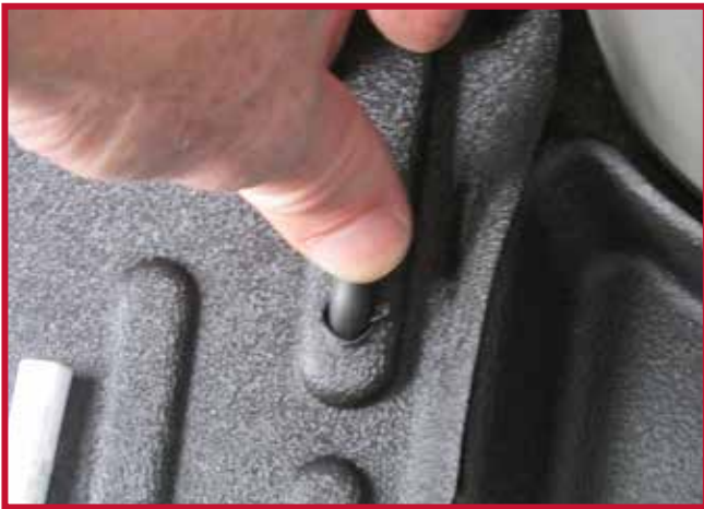
Figura 10 - Aplicar presión al gancho