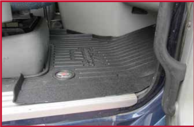
Figura 5 - Tapete del pasajero recortada e instalado con el asiento EzyRider

7. Pruebe al colocar el tapete del conductor en el camión. El tapete del conductor está diseñado para encajar debajo del pedal del acelerador. Para instalar el tapete del conductor, levante la parte del talón del pedal del acelerador y deslice la parte delantera del tapete por debajo del pedal. Compruebe que el tapete está empujado completamente hacia delante para que descansa contra la pared de fuego. La figura 6 muestra el tapete del conductor instalado en un camión con asiento OEM.