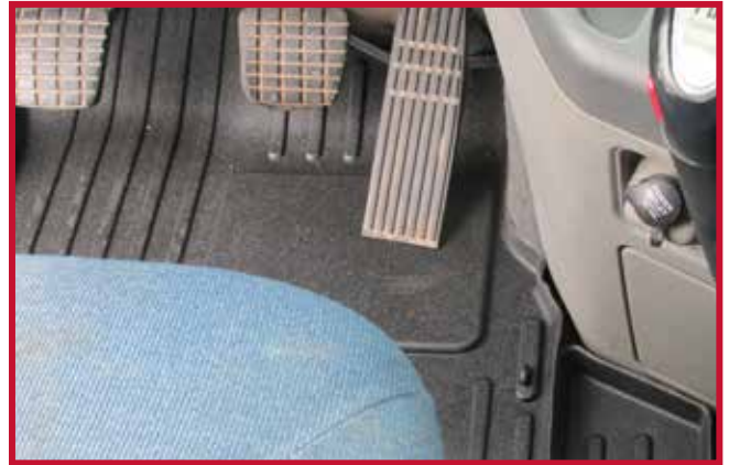
Figura 11 - Gancho del conductor correctamente instalado