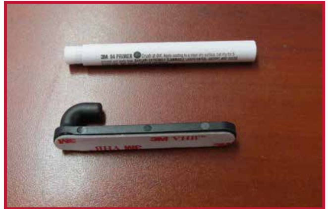
Figure 8 – Crochet de retenue et Apprêt 94

9. Introduzca el gancho a través del orificio situado en el borde derecho del tapete del conductor, tal como se muestra en la figura 9. El gancho debe quedar al ras de la parte inferior del tapete del conductor.