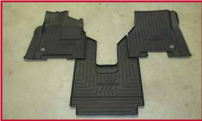
Figura 1 - Contenido del kit FKFRTL3MB