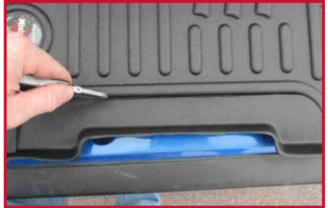
Figura 7 - Recorte del tapete del conductor para su instalación con el asiento EzyRider o con un asiento del mercado de accesorios.

8. Dentro del paquete con las instrucciones de instalación, localice un gancho de retención de plástico negro, así como un tubo blanco de Primer 94 como se muestra en la Figura 8.