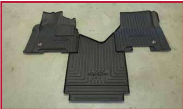
Figura 2 - Contenido del kit FKFRTL3AB