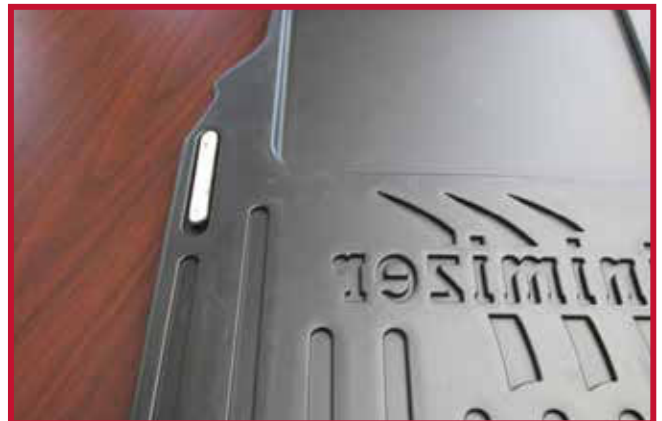
Figura 8 - Gancho y aplicación de Primer 94

10. Una vez colocado el gancho, deje que el tapete del conductor y el gancho descansen en el piso del camión.