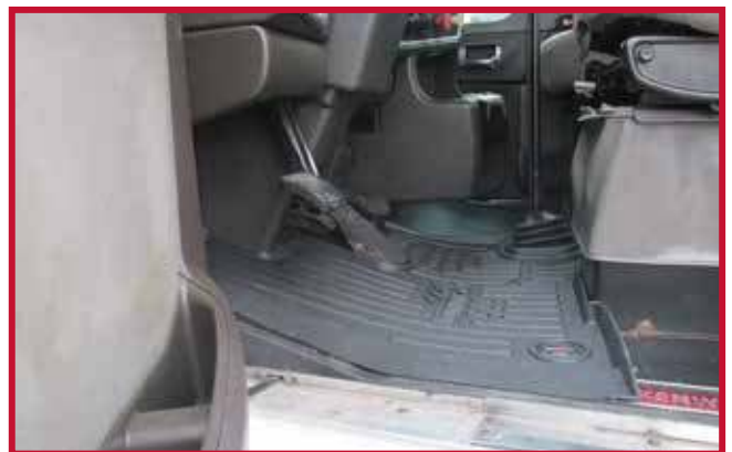
Figura 7 - Ajuste del tapete del conductor