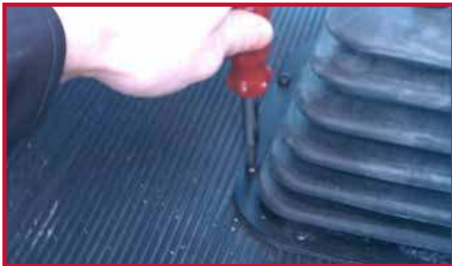
Figura 8 - Retire el tornillo de la bota de la palanca de cambios

• Introduzca el tornillo a través del orificio del gancho de retención como se muestra en la figura 7.