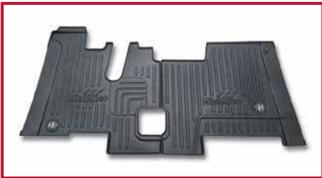
Figura 4 - Kit de tapete #100889