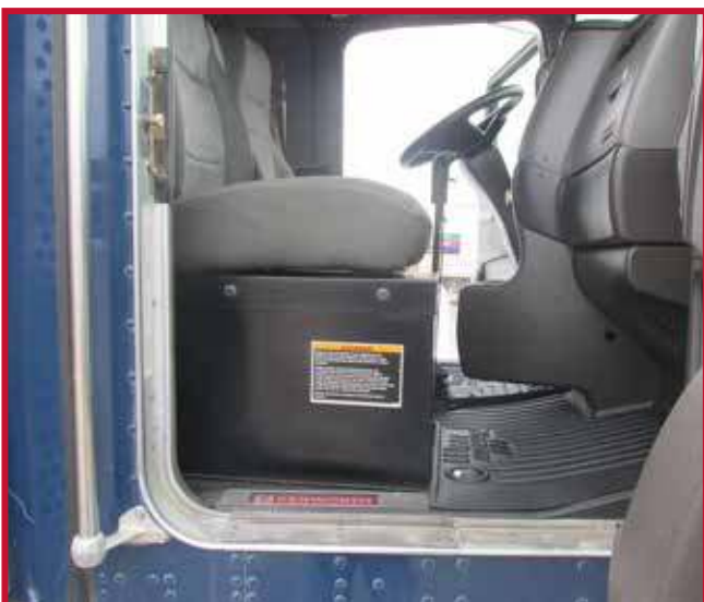
Figura 14 - Caja de la batería del asiento del pasajero con tapete recortado

• Utilice una navaja afilada para cortar el tapete. Siga a lo largo del borde interior alto y conserve el borde para la contención de líquidos. Véase el ejemplo de la figura 15.