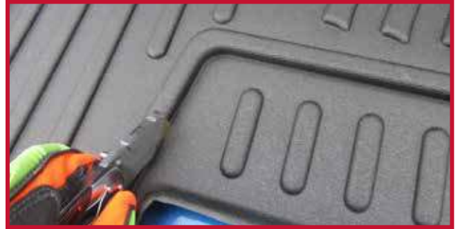
Figura 15 - Recorte del tapete del pasajero

13. Instale el gancho de retención del tapete del pasajero. Aplique Primer 94 en la zona mostrada en la figura 16 y repita el paso 7b anterior para fijar correctamente el gancho al umbral de plástico de la puerta. La figura 17 muestra una instalación correcta del gancho.