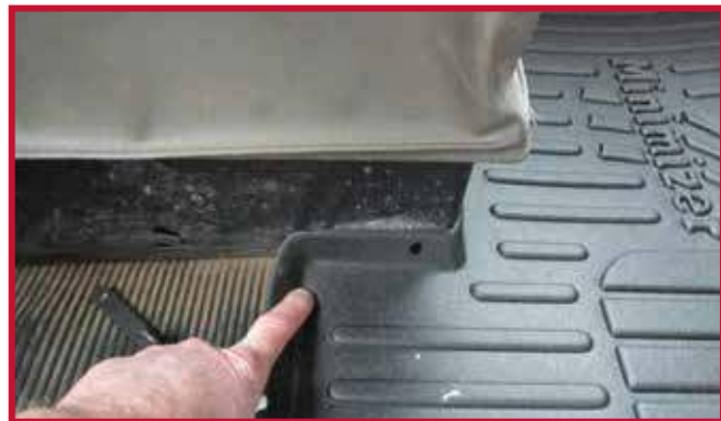
Figura 10 - Ubicación del gancho del tapete del conductor

• Retire el tapete del conductor del camión.