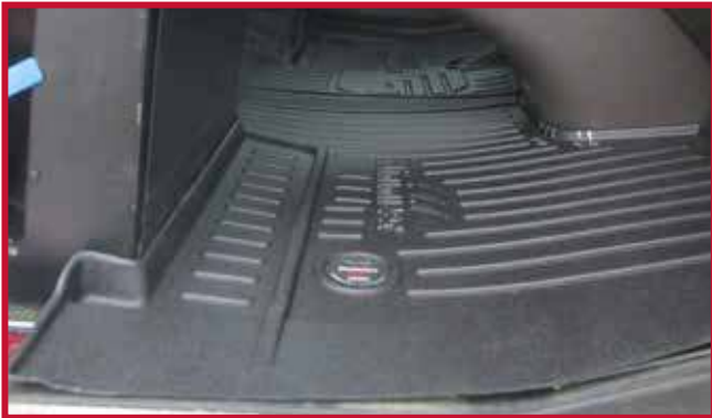
Figura 13 - Ajuste del tapete del pasajero

• Si el camión está equipado con un asiento de pasajero con caja de batería debajo del asiento, como se muestra en la figura 14, el tapete del pasajero debe recortarse para que encaje correctamente.