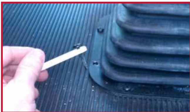
Figura 9 - Instalación del gancho en el tornillo existente

• Vuelva a colocar el tornillo en el agujero original y apriételo. Oriente el gancho del tapete para que apunte hacia la parte delantera del camión.