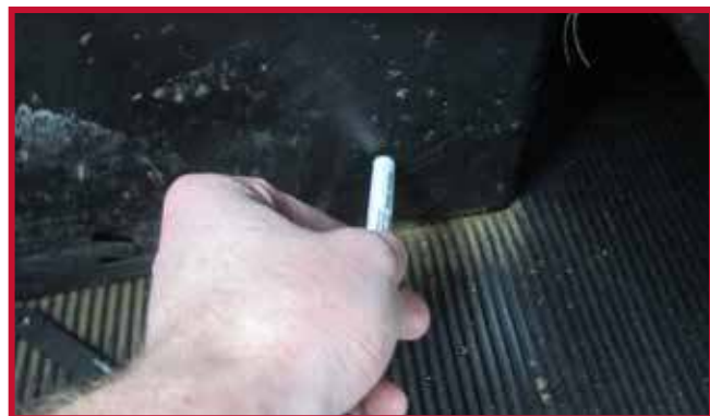
Figura 11 - Aplicar Primer 94 a la base del asiento

• Deje secar el Primer 94 sobre la superficie de la base del asiento durante 5 minutos.