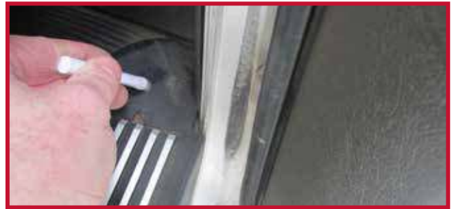
Figura 17 - Gancho del tapete del pasajero instalado