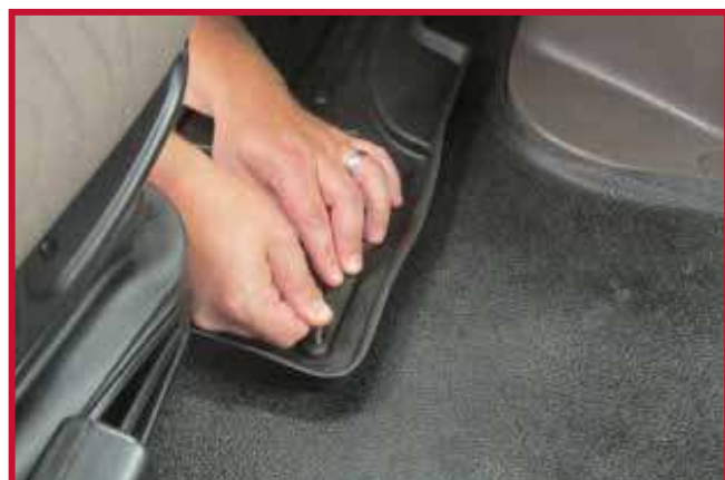
Figura 12 - Aplicar presión al gancho

• Para lograr una adhesión óptima, no se debe mover el gancho durante un período de 20 minutos después de la instalación.