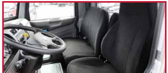
Figura 7 - Asiento de banco para dos personas