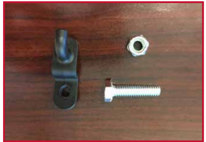
Figura 11 - Gancho de retención y herrajes