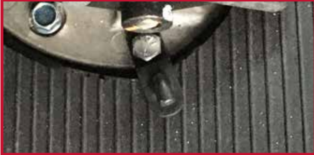
Figura 13 - Gancho de retención y herrajes

11. Coloque el tapete del conductor en el camión y fije el tapete al gancho de retención.