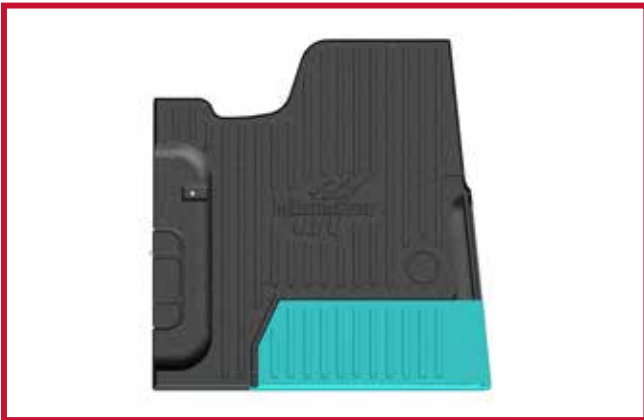
Figura 9 - Diagrama de recorte