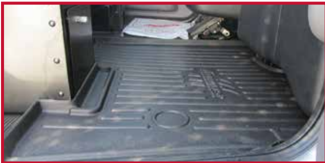
Figura 2 - Asiento del pasajero con compartimento de almacenamiento