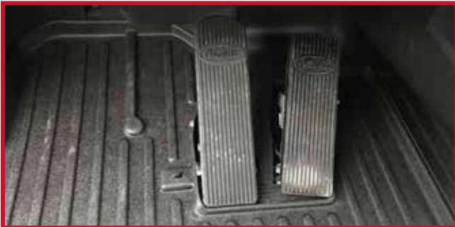
Figura 14 - Tapete del conductor instalado con gancho

12. Tire del tapete del conductor para confirmar que el gancho está completamente encajado en el tapete. Si el gancho no funciona correctamente o el tapete no puede instalarse de forma segura, no utilice un tapete Minimizer en el lado del conductor del vehículo.