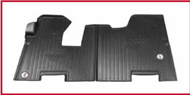
Figura 1 - Kit de tapetes 105036