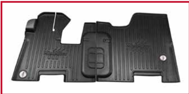
Figura 4 - Kit de tapetes 105037