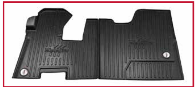
Figura 6 - Kit de tapetes 105038