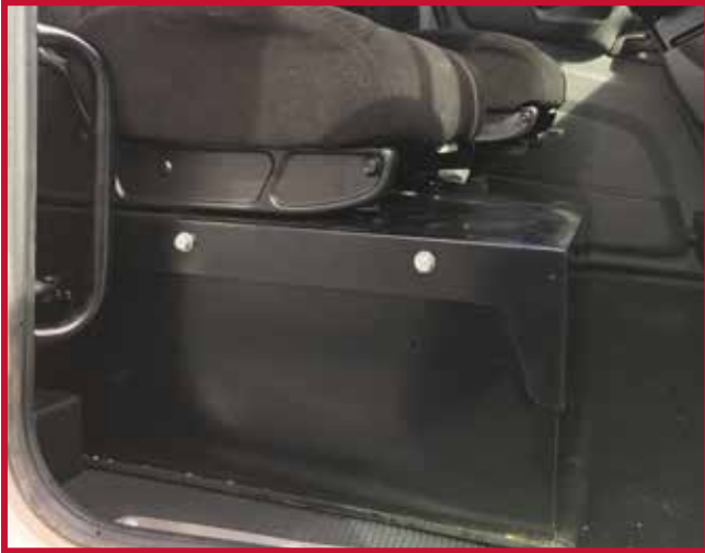
Figura 8 - Caja de la batería con base del asiento del pasajero