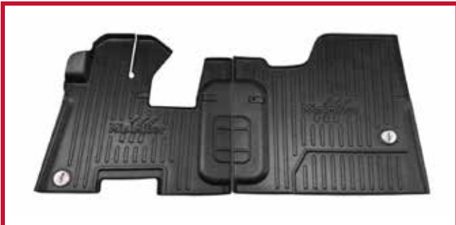
Figura 10 - Kit de tapetes 105039