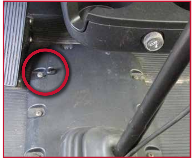
Figura 15 - Perno de montaje del pedal de freno

17. Antes de utilizar el vehículo, lea las instrucciones de seguridad para el manejo del vehículo.