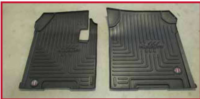
Figura 3 - Contenido del FKSTAR3B

** El tapete del pasajero FKSTAR3B requiere ser recortado a mano. Consulte el paso 15 de la instalación para más detalles.