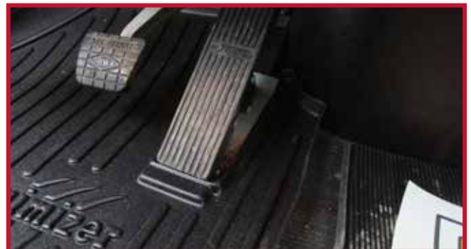
Figura 5 - FKSTAR3B Instalación del tapete del conductor

• En algunos casos, se montará un armario eléctrico de acero o plástico en la zona del suelo en la esquina delantera izquierda de la cabina, como se muestra en la figura 6. Si el armario eléctrico está presente, la parte delantera izquierda del tapete del conductor tendrá que ser recortado a mano a lo largo de la costilla elevada. El área a recortar está sombreada en rojo en la Figura 7.