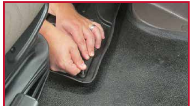
Figura 10 - Aplicar presión al gancho

15. Coloque el tapete del pasajero en el camión. Asegúrese de que el tapete del pasajero está empujado completamente hacia delante para que el borde haga pleno contacto con el panel de revestimiento de la cabina y la pared de fuego.