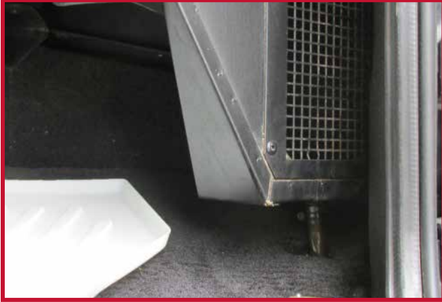
Figura 11 - Unidad HVAC de alta capacidad

• Para los modelos Western Star 4900SA, 4900FA, 4900SB, 4900SF de los años 1998 a 2011, la zona sombreada en amarillo que se muestra en la figura 12 probablemente tendrá que ser recortada a mano a lo largo de la costilla elevada en el momento de la instalación. Pruebe el tapete antes de recortarla para confirmarlo.