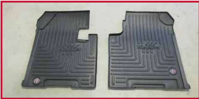
Figura 2 - Contenido del FKSTAR2B

• Kit FKWS3B es compatible con los modelos Western Star 4900SA, 4900FA 1998-2011