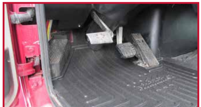
Figura 6 - Recinto eléctrico del lado del conductor y tapete del piso

• En algunos casos, se montará un armario eléctrico de acero o plástico en la zona del suelo en la esquina delantera izquierda de la cabina, como se muestra en la figura 6. Si el armario eléctrico está presente, la parte delantera izquierda del tapete del conductor tendrá que ser recortado a mano a lo largo de la costilla elevada. El área a recortar está sombreada en rojo en la Figura 7.