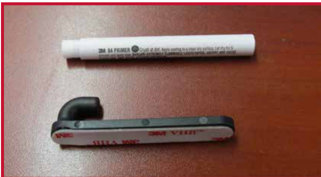
Figura 8 - Gancho y Primer 94

7. Introduzca el gancho a través del orificio de la esquina trasera derecha del tapete del lado del conductor. El gancho debe quedar al ras de la parte inferior de la alfombra del piso.