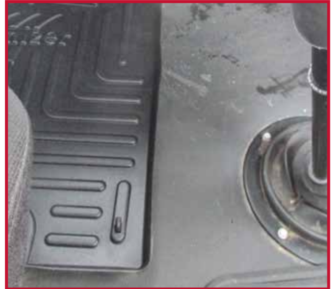
Figura 9 - Instalación del gancho del tapete del conductor

9. Desembale el tubo de Primer 94 y lea las precauciones de seguridad impresas en el tubo.