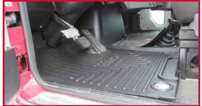
Figura 4 - Posición del tapete del conductor

• El tapete del conductor debe ser empujado completamente hacia delante para que el borde delantero haga pleno contacto con el panel de la cabina y la pared de fuego.