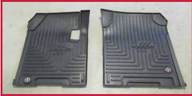
Figura 1 - Contenido del FKSTAR1B

• El kit FKWS2B es compatible con los modelos Western Star 4900SA, 4900FA, 4900SF y 4900SB de 2012 a 2016.